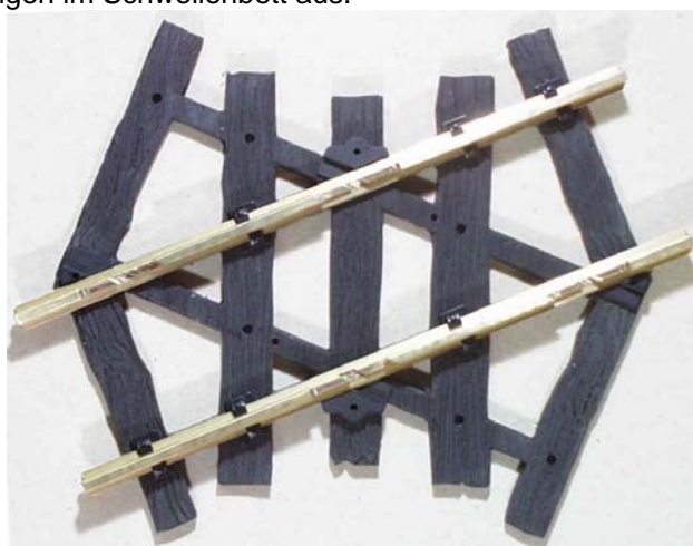
Abb. Kreuzung 45°

Schieben Sie bitte jetzt die Schienenverbinder (10) auf die Profilenden auf, fertig ist Ihre 60°-Kreuzung zur Probefahrt.