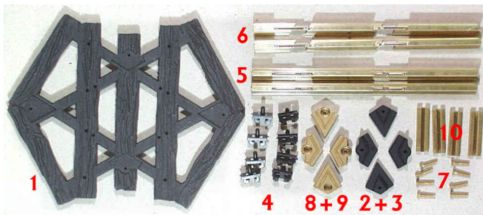
Abb. Kreuzung 60°

Unsere Empfehlung für den Kunststoffkleber: Ruderer L530, Art.-Nr. 7901